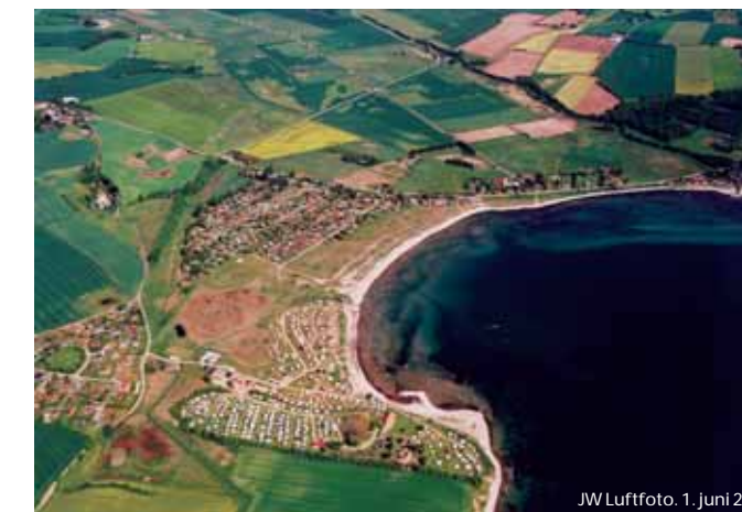
1. juni 2003

Efter vandreturen ved Slivsø har du mulighed for at slappe af ved Diernæs Bugt. Her er god badestrand og mulighed for at købe en is om sommeren. Især om vinteren er der gode muligheder for at iagttage havfugle i bugten.