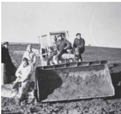
Gravning af kanaler i Slivsø 1957/58

I tiden omkring anden verdenskrig opstod tanken om at dræne søen og omskabe søbunden til frugtbar agerjord. Afvandingsprojektet tog form gennem 1950'erne.