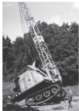
.....det var ikke så let