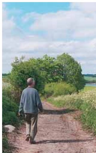
Udsigt fra den gamle Kirkesti fra Diernæs