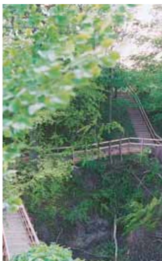
Trappen over Skærbækslugten