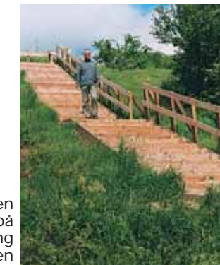
En trappe går op til stien der forløber smukt på den nordlige skræning ned mod søen

Ved bådebroen og udsigtstårnet er der et dejligt opholdssted med borde og bænke.